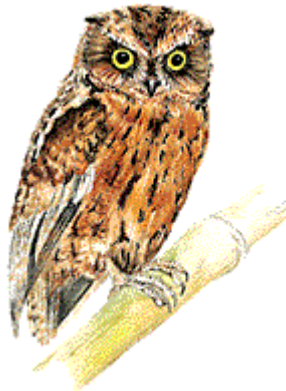
Fig. 1 - Otus hartlaubi

Otus também é um gênero de coruja (vide imagem abaixo), ave conhecida por sua excelente visão noturna e que representa inteligência e atenção, características que buscamos implementar em nosso sistema.